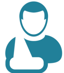
Diagnoses & verrichtingen