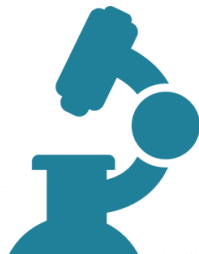
Path. Micro. uitslagen